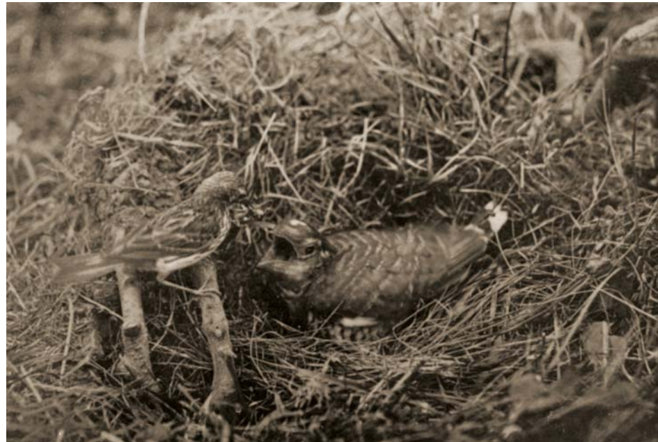
Graspieper met insecten in de snavel bij jonge koekoek. Kerkwerpe, 2 augustus 1919.

De fotonegatieven waren allemaal glasplaten. Vijverberg maakte de mapjes voor de negatieven ook zelf. Zuinig als hij was, gebruikte hij daar soms ook oude brieven en rekeningen voor, zodat aan de binnenkant van de mapjes veel wetenswaardigs te lezen viel!