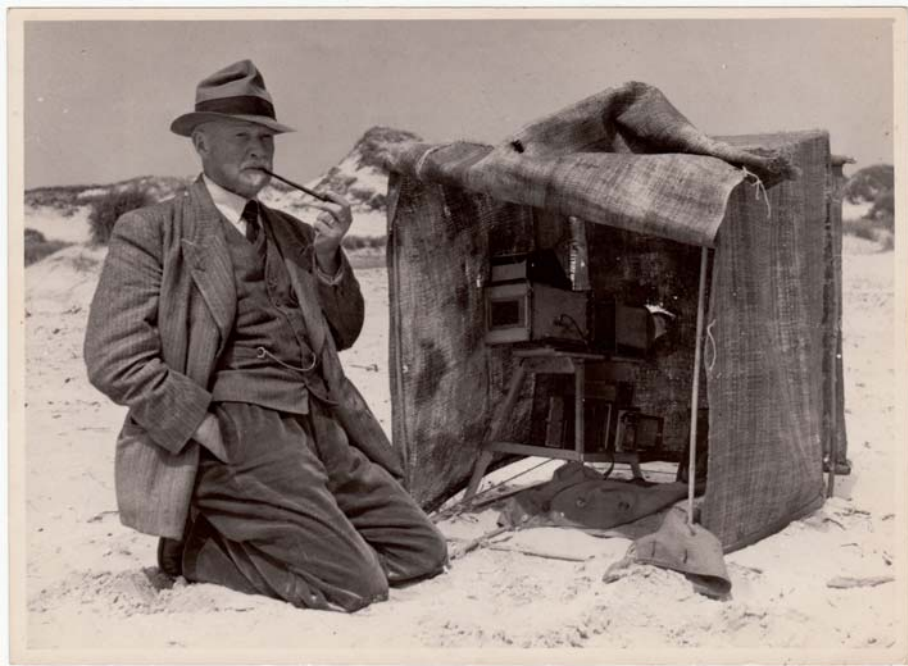
In 1952 bij het nest van de kleine plevier in de duinen bij Haamstede.

B ijna dagelijks trok Vijverberg erop uit met zijn camera's en zijn opvouwbare schuilhut. In de hut sloot hij zich op om van daaruit (water)vogels te bestuderen en te fotograferen. Hij verborg zich in kisten en groef zich soms in in de grond. Uren bracht hij er door om aan zijn taak te werken. Van ongeveer honderd vogelsoorten maakte hij foto's, sommige soorten werden wel vijftig keer gefotografeerd. En dat alles met primitieve camera's, het meeste in zwart/wit en gemaakt zonder belichtingsmeter.