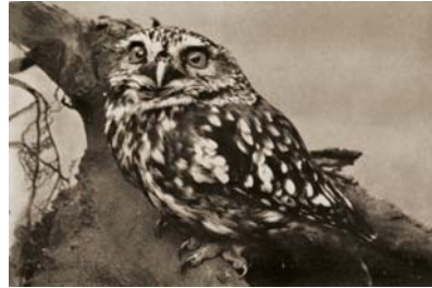
Steenuil, oude vogel, op een boomstronk, Noordgouwe, juni 1912.

Het was voor zijn leerlingen 'verplichte' literatuur.