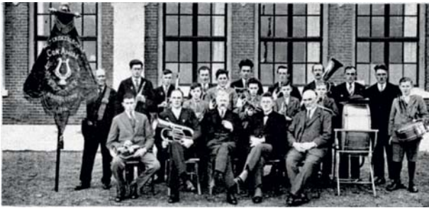
Muziekgezelschap "Con Amore" bij het 25-jarig jubileum in 1935.

Niet alleen de vogels hadden de belangstelling van Vijverberg. Ook op tal van andere terreinen was de vogelkenner actief. Op 9 september 1910 richtte hij de Noordgouwse muziekvereniging Con Amore op, waarvan hij jarenlang voorzitter zou zijn.