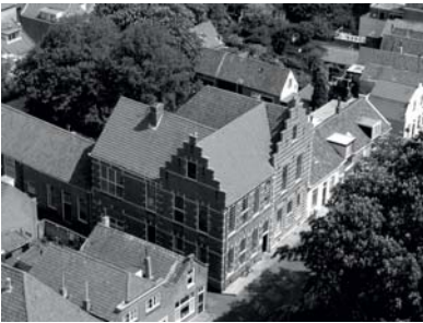
De kweekschool was van 1925 tot 1936 gevestigd in het gebouw de Driehoek aan het Kerkhof Noordzijde.