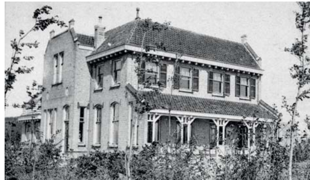
Het ziekenhuis in Noordgouwe in 1910 - 1920. Het werd gebouwd in 1902. In 1942 is het overgegaan in handen van de eilandelijke gemeenten en er werd een nieuwe vleugel aangebouwd. In 1957 kwam er een einde aan het bestaan als ziekenhuis, na de bouw van een nieuw ziekenhuis in Zierikzee. Sinds 2007 herbergt het gebouw kuuroord "De Schouw".