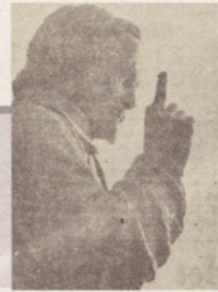
Vingertje Cats in het Zeeuwsch Dagblad, 26-09-1959

Het oorspronkelijke beeld van Jacob Cats had geen moralistisch, opgeheven vingertje. Op de eerste afbeelding uit 1830 maakt de dichter het klassieke gebaar van de redenaar.