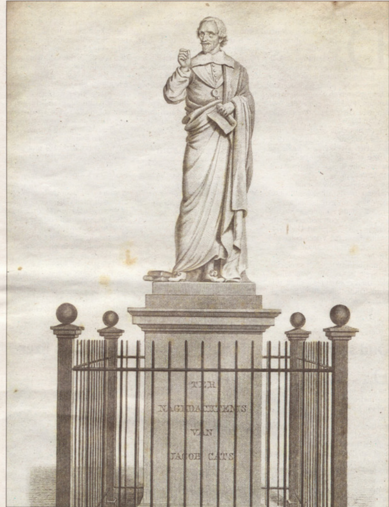
Het ultieme bewijs: Cats zonder vingertje op een afbeelding uit 1830.